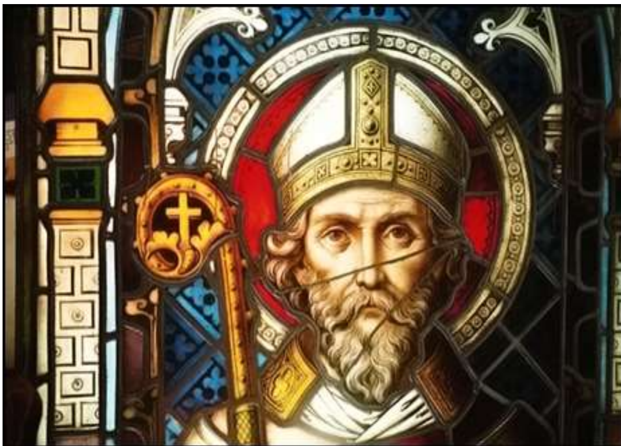
Sv. Vojtěch ve vitráži katedrály v Olomouci.

(zpracováno s využitím otevřených zdrojů, ilustrace - cbna)